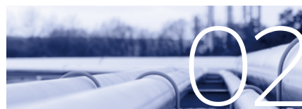
02 容器及管道气体检测