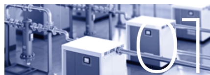
01 气体干燥设备气体检测