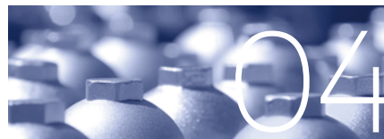
04 各种工业气体水分检测